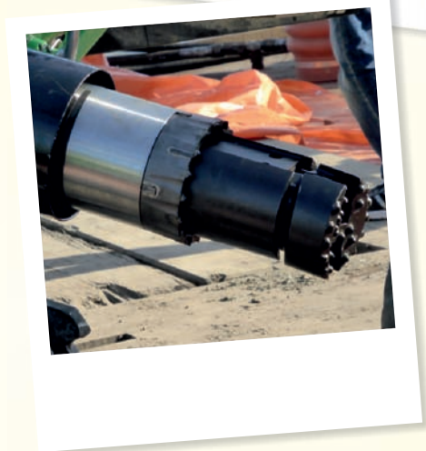
ausgeklappt vor dem Rohr