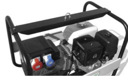
GANCIO DI SOLLEVAMENTO LIFTING HOOK