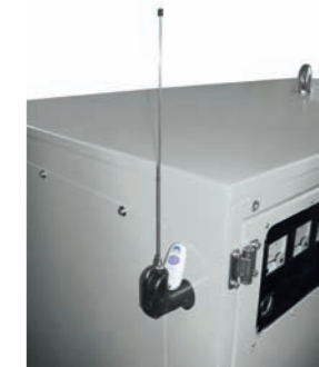
RADIO COMANDO RADIO REMOTE CONTROL

Disponibile su Available on 1500 - 3000 RPM