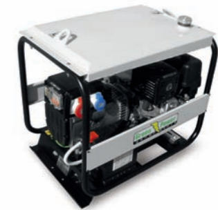
SERBATOIO MAGGIORATO OVERSIZED FUEL TANK