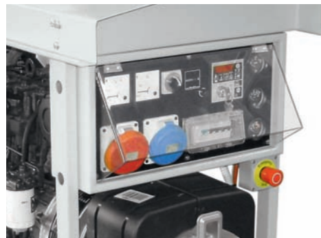
COPERCHIO QUADRO PANEL COVER PROTECTION