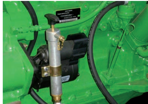
POMPA OLIO OIL PUMP