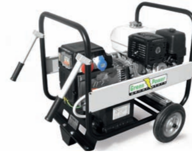
KIT CARRELLO SLOW SPEED TRAILER