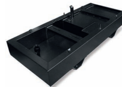
VASCA DI RACCOLTA LIQUIDI BOUNDED TANK

Disponibile su Available on 1500 - 3000 RPM