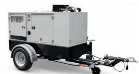
CARRELLO STRADALE ROAD TOW TRAILER

Disponibile su Available on 1500 - 3000 RPM