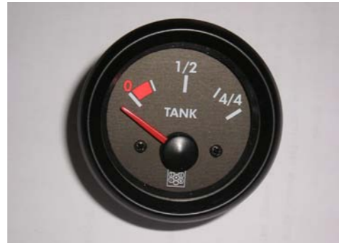
LIVELLO INDICATORE BENZINA FUEL LEVEL INDICATOR