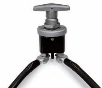
STACCA BATTERIA BATTERY ISOLATOR SWITCH

Disponibile su Available on 1500 - 3000 RPM