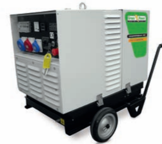
CARRELLO MANUALE TROLLEY KIT