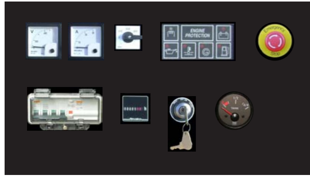
QUADRO DI COMANDO CONTROLLO STANDARD CON: Q1 - Q2 - Q3 - Q4 - Q6 - Q7

CONTROL PANEL STANDARD ON: Q1 - Q2 - Q3 - Q4 - Q6 - Q7