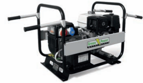
KIT BARELLABILE HANDLES KIT