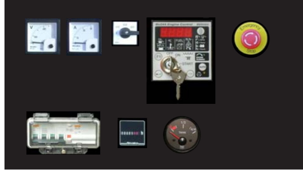
QUADRO DI COMANDO CONTROLLO STANDARD CON: Q8 - Q9

CONTROL PANEL STANDARD ON: Q1 - Q2 - Q3 - Q4 - Q6 - Q7