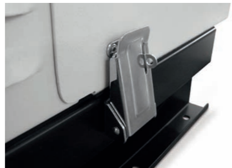
RIBALTA LUCCHETTABILE VERTICAL LOCKABLE DOOR