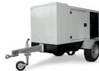
CARRELLO TRAINO LENTO SLOW SPEED TRAILER

Disponibile su Available on 1500 - 3000 RPM