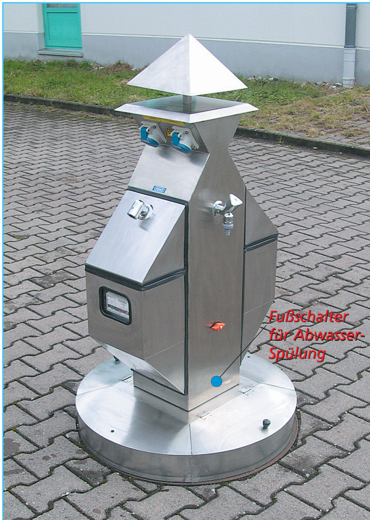
(Abb. mit optionaler Beleuchtungspyramide)