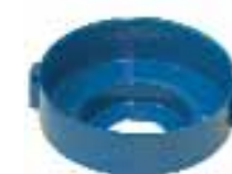
EmbasUO sur robinet YACUO et SPHERUO