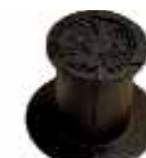
Tête de bouche à clé 86