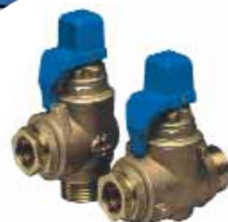
Robinet de prise en charge 1/4 tour