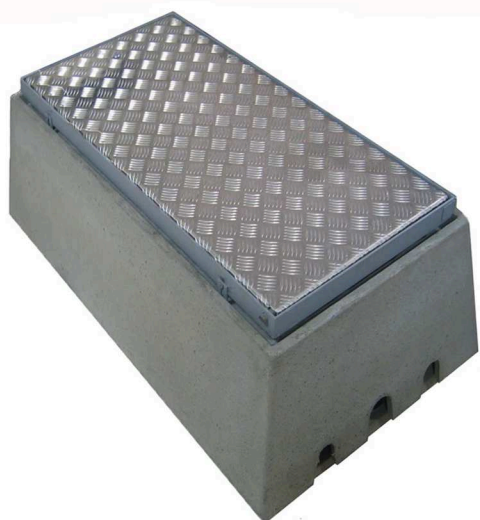
Cadre acier et couvercle aluminium articulé