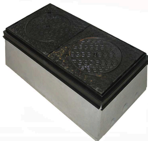
Cadre de remise à niveau noir pour tampon fonte 125 ou 250 KN en 2 parties