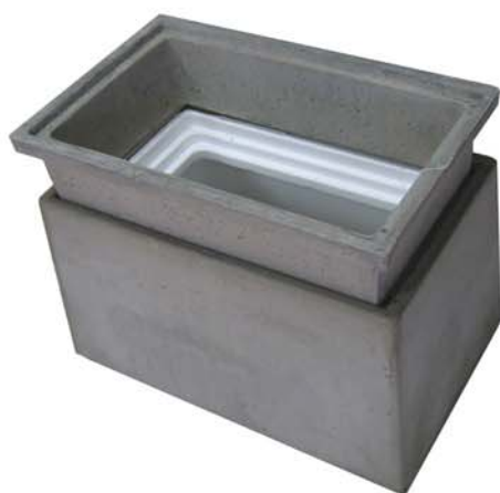
Regard avec réhausse CCV de 150 mm et coque isolante en polystyrène extrudé

MATERIAU : ciment renforcé de fibres de verre.