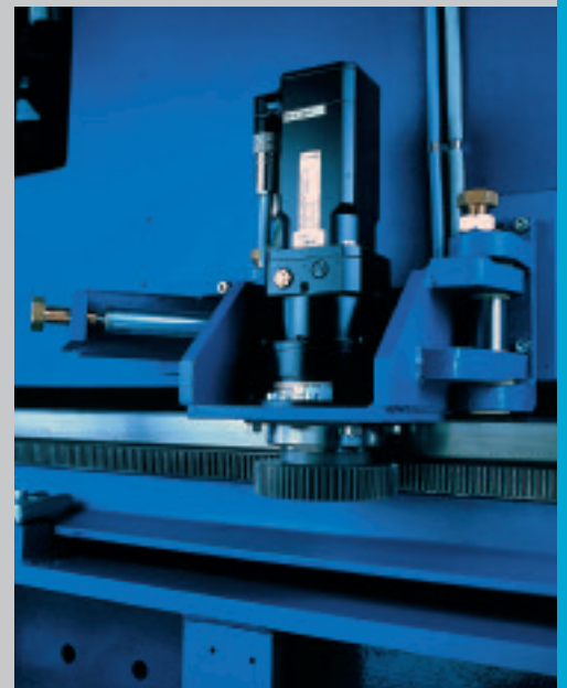
Motoriduttori AC longitudinali ammortizzati per incrementare produttività e precisione. Double motorisation AC pour production et précision accrues.