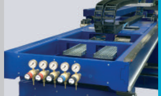
Portale a doppia sezione per alta rigidità e precisione superiore. Double poutre pour une meilleure rigidité à moindre poids.