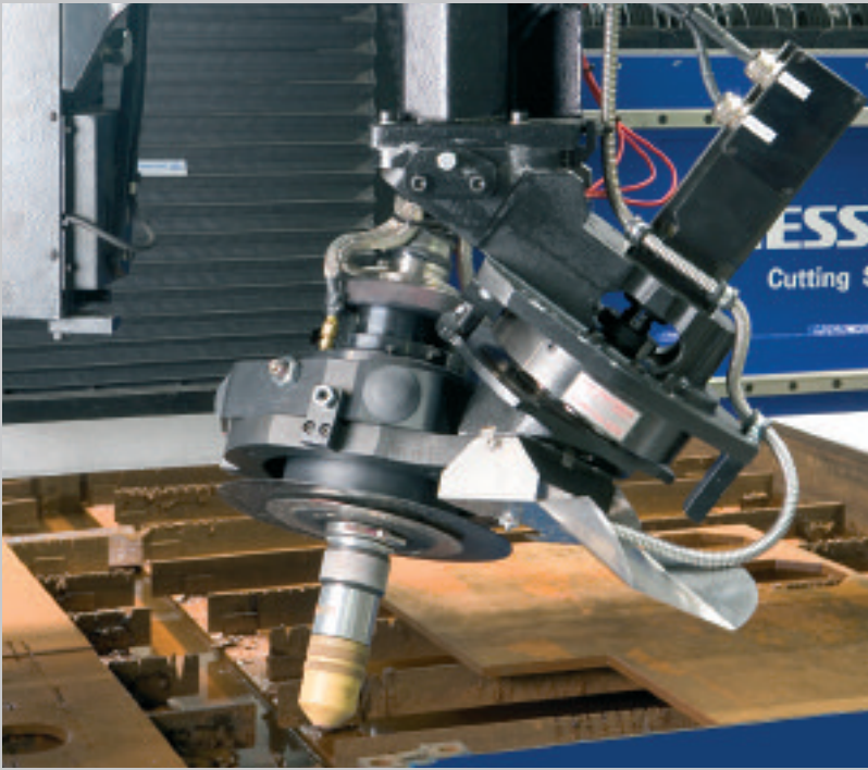
Skew Rotator ∞