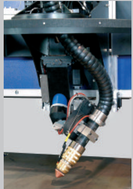
Skew Rotator Δ