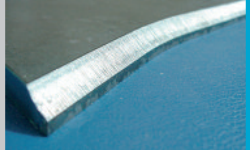
Schweißkantenvorbereitung mit einem Werkzeug Weld seam preparation with one tool