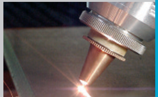
Fasenschneiden bis 45° (59°) zur Schweißkantenvorbereitung Bevel cutting up to 45° (59°) for weld preparations