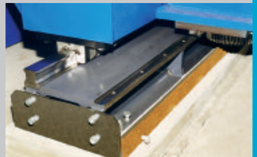
Hochgenaue Linearführung in Längs- und Querrichtung kombiniert mit wartungsfreien AC-Motoren sorgen für Schnelligkeit und Präzision High accuracy linear guides for longitudinal and transverse motion combined with maintenance free AC motors ensure speed and precision