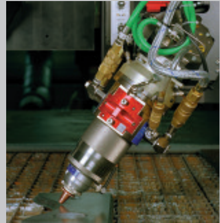
Chanfreinage continu jusqu'à 50° Regolazione dello smusso in continuo fino a 50°